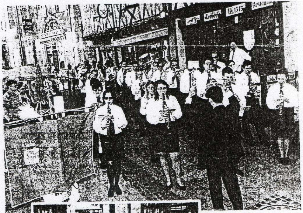
Brembate Sopra, en musique, lors d'une halte citadine place des Minimes.

A noter que, dans l'après-midi de samedi, les deux harmonies ont parcouru les rues